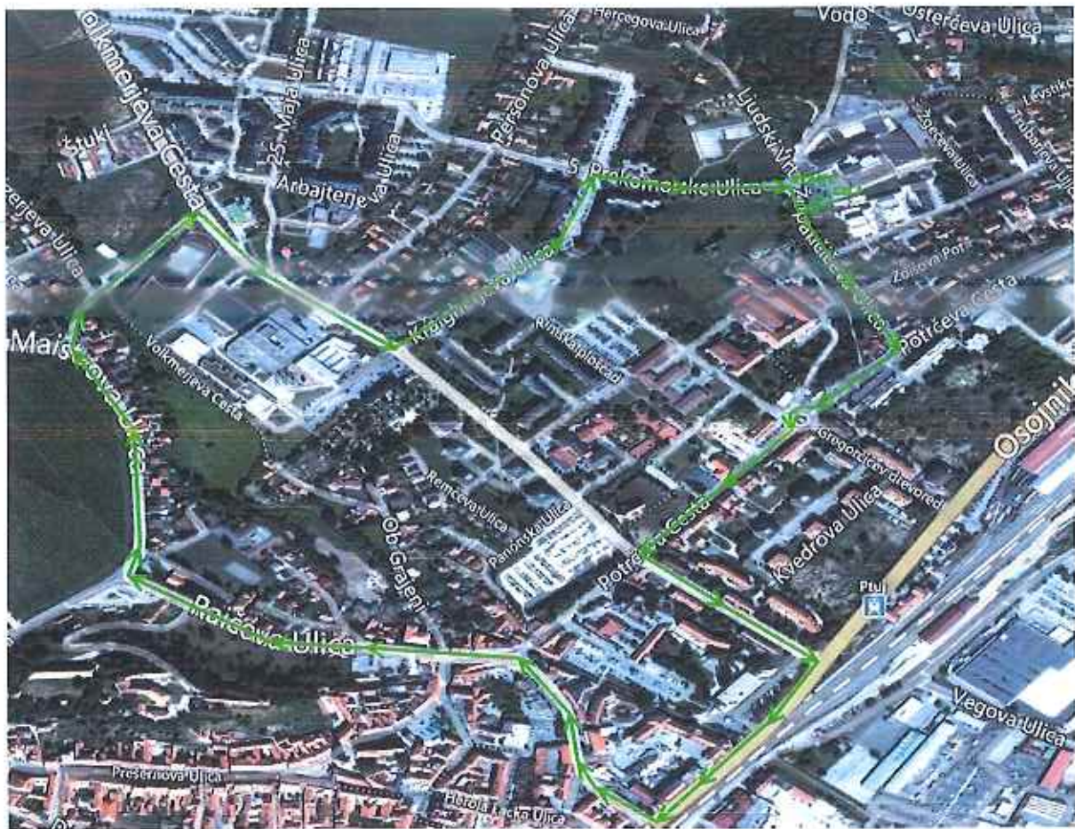
Slika 5: Patek proge po prometnih površinah za kolesa z motorjem