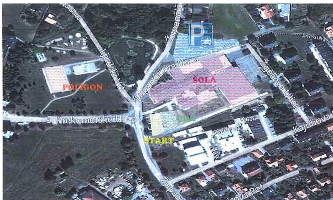
Slika 1: Načrt prireditvenega prostora