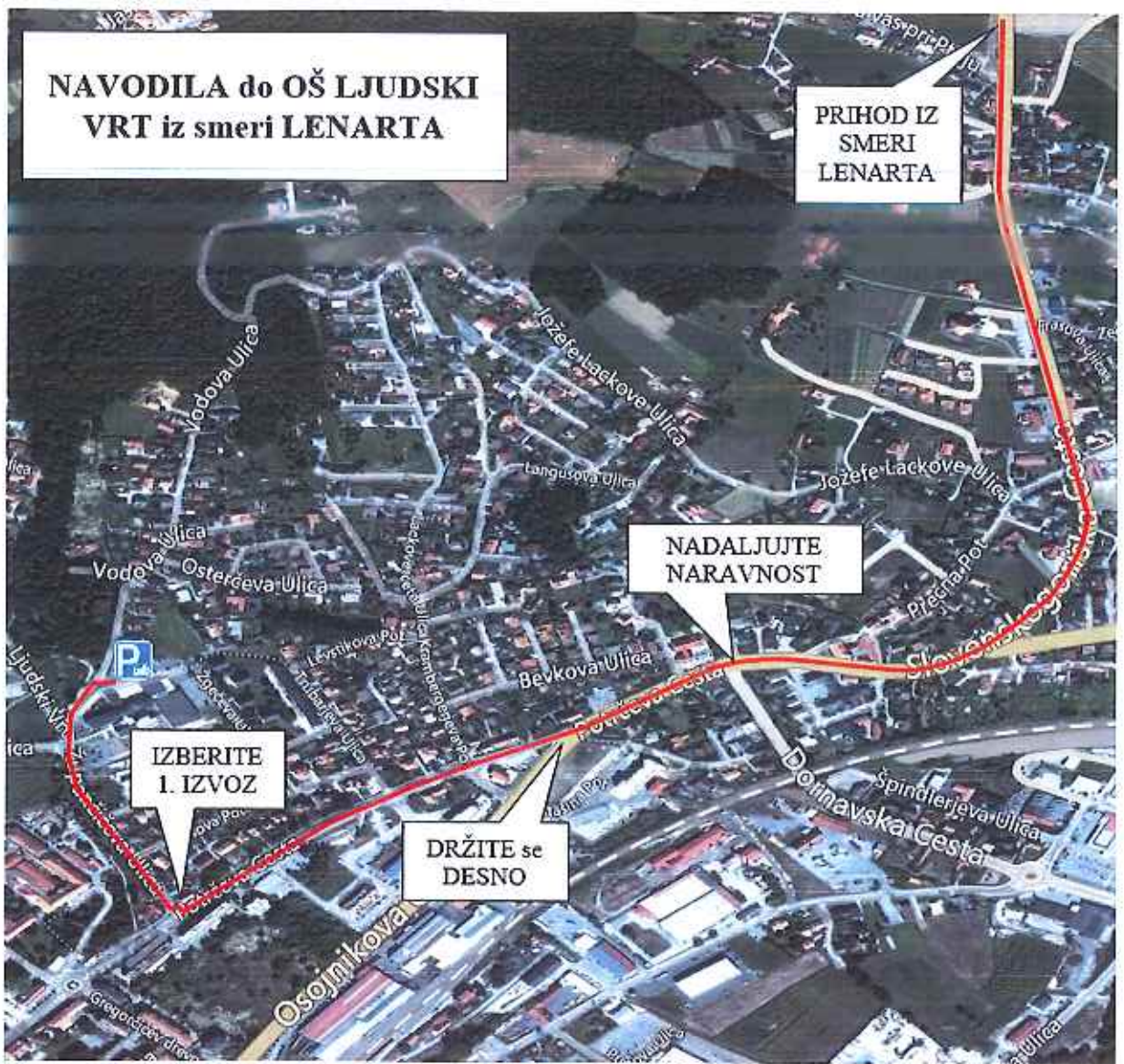
Slika 2: Navodila za pot iz smeri Lenarta