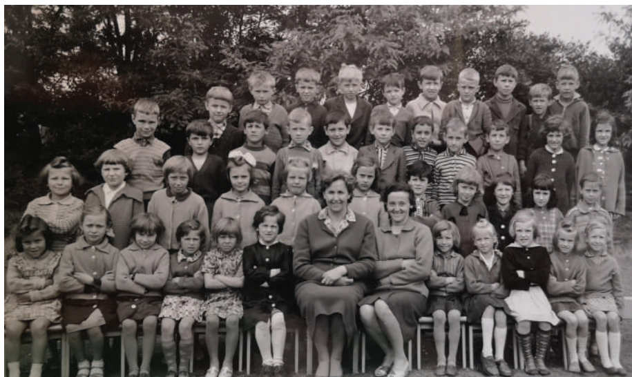
Učenci (1961-1962)