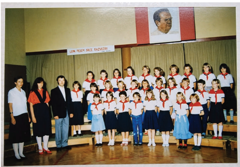
Pevski zbor