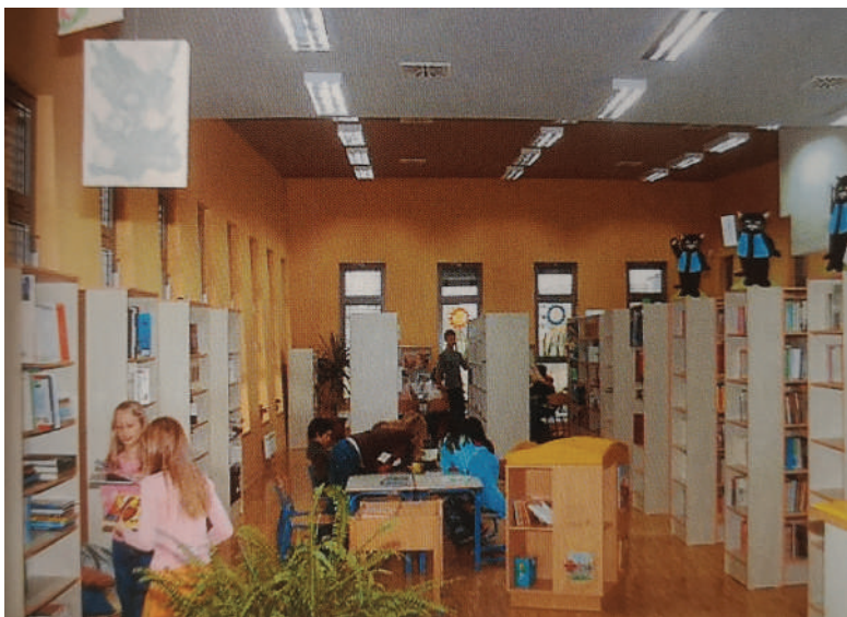
Šolska knjižnica, šolski arhiv

Kot vidim danes mojo, našo šolo – zelo uspešno in ustvarjalno! In le želim si lahko, da bi prav vsak učenec, kadar se spominja osnovnošolskih časov, s prijetnimi občutki rekel, da je to njegova šola in da je v njej preživel zelo lepe čase.