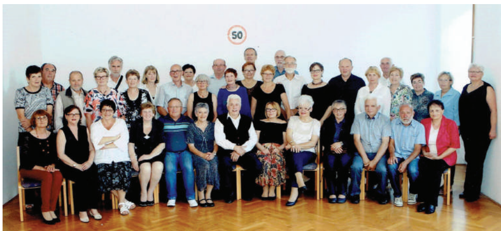
Obletnica