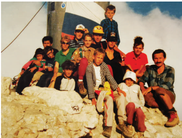
Planinski izlet