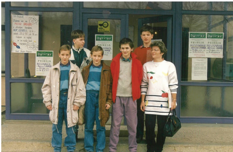
Na šahovskem tekmovanju

Če bi moral izbrati najlepši spomin iz osnovnošolskih časov, bi izbral naše uspehe na šolskih šahovskih tekmovanjih, ko smo pod mentorstvom zdajšnje ravnateljice ge. Tatjane kot vrhunec dosegli 2. mesto na državnem osnovnošolskem ekipnem prvenstvu (leta 1993 v Črnomlju).