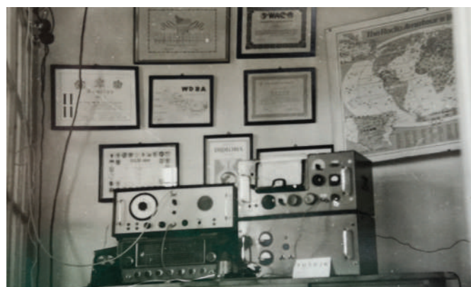
Šolski radio (1965), arhiv šole