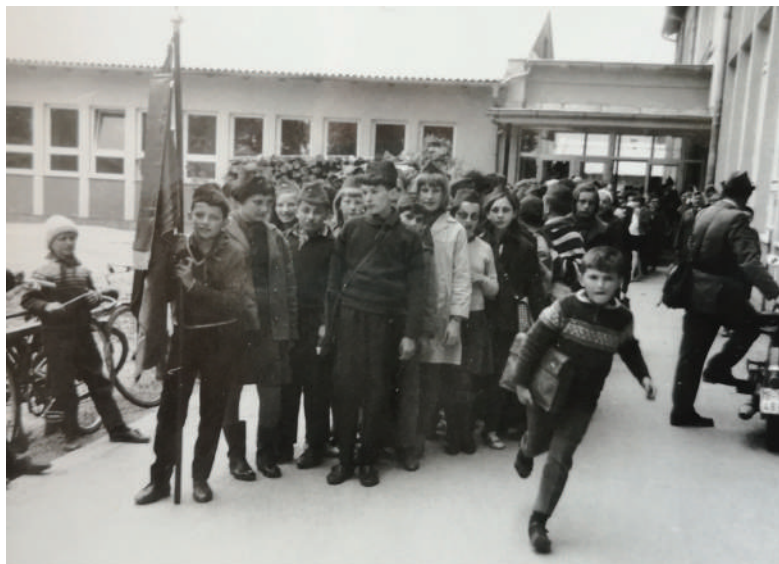
Kurirčkova pošta, arhiv šole