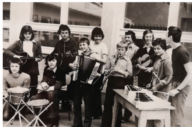
Šolski ansambel The United Spooks (1975), arhiv šole