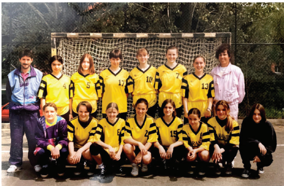
Šolska rokometna ekipa