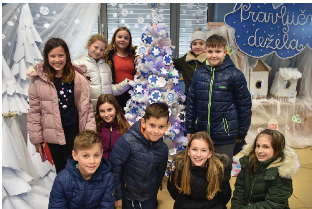
Zimska pravljica