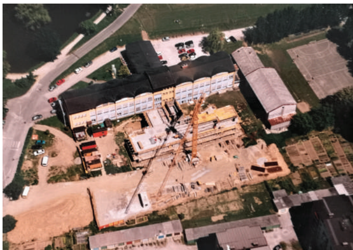
Gradnja prizidka