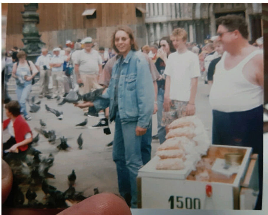
Na ekskurziji