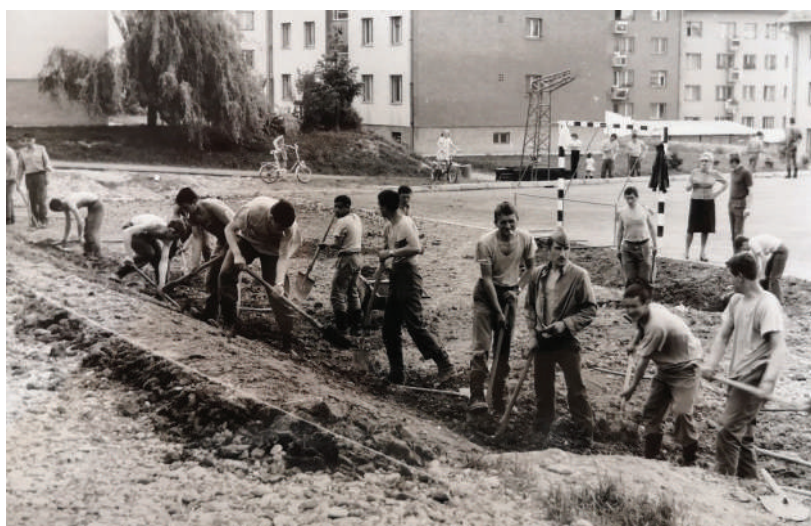
Vojaki pomagajo pri izgradnji igrišča