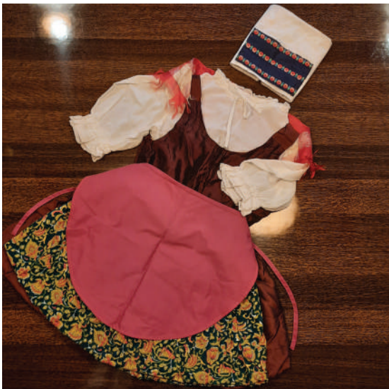
Plesna noša