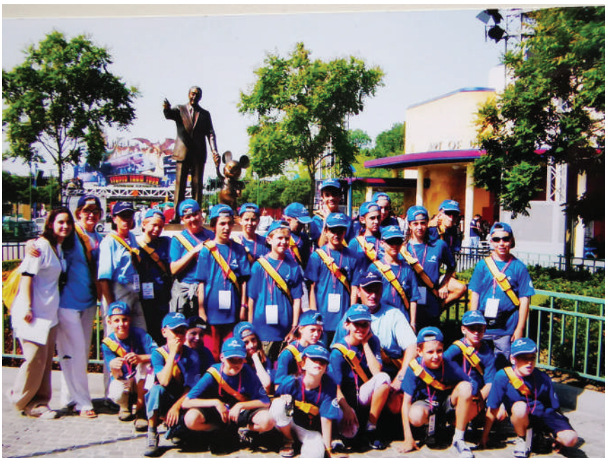
Zmagovalci v Parizu