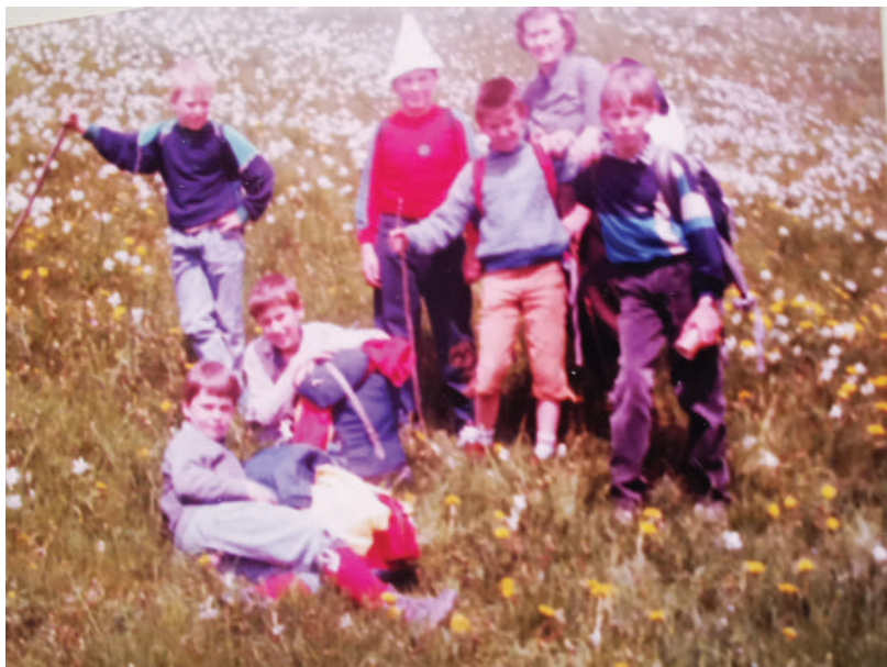
Na Golici