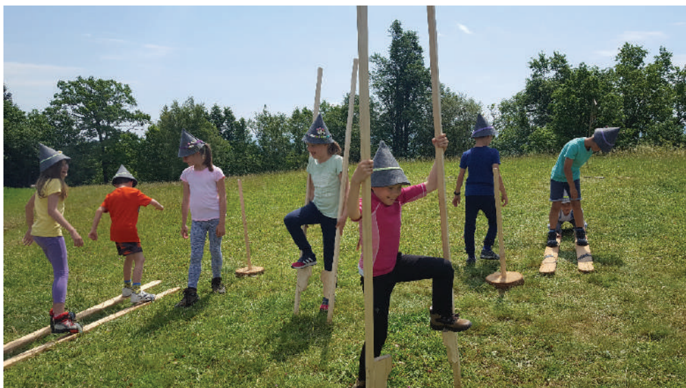
Otroška igrala, šolski arhiv