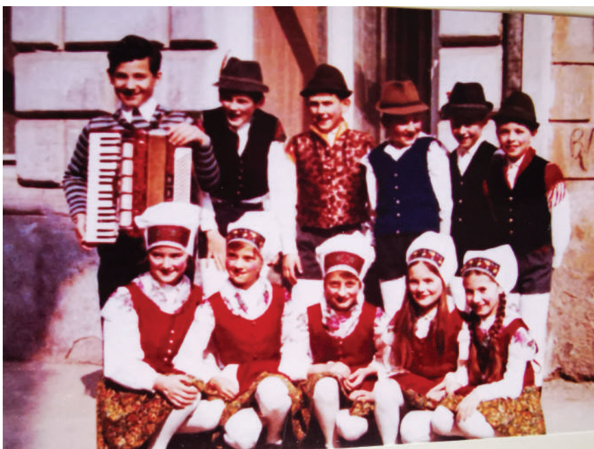
Folklorna skupina