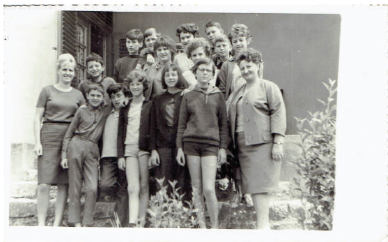
Na izletu

Za zaključek pa še slike s 50. obletnice zaključka osnovne šole.