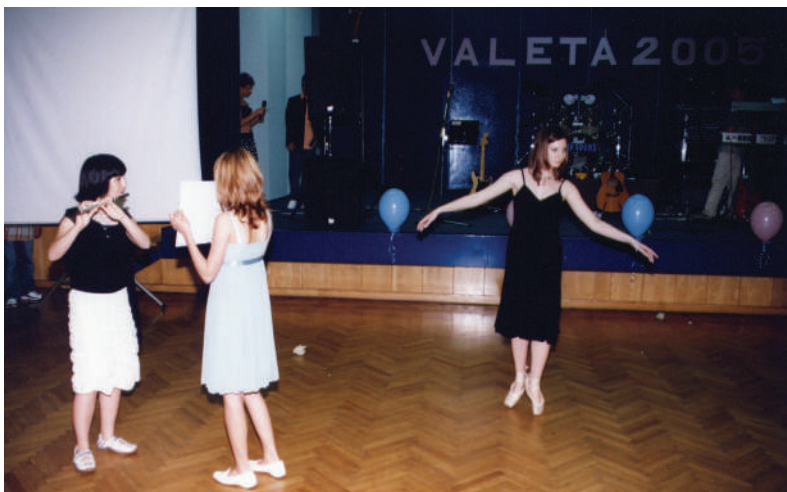
Valeta, arhiv avtorice

Spomini na Osnovno šolo Ljudski vrt so lepi in še vedno zelo živi, čeprav je od zaključka minilo že kar nekaj let. Vsekakor je bil začetek šolanja na naši šoli ključen za uspešno nadaljevanje poti do zdravniškega poklica. Vedno se rada spominjam tistih veselih in sproščenih dni, ki so bili tudi polni izzivov odraščanja. Skupaj smo jih uspešno premagovali in se s tem urili za življenjske izzive.