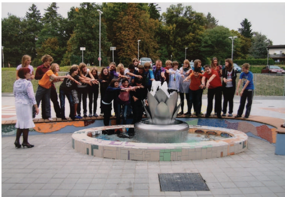
Otvoritev šolskega atrija

Bil je čas počitnic, nekaj tednov pred začetkom pouka, mi pa smo svoj prosti čas namenili druženju, spoznavanju novih veščin in občutku, da smo s svojim delom prispevali k novi podobi šole.