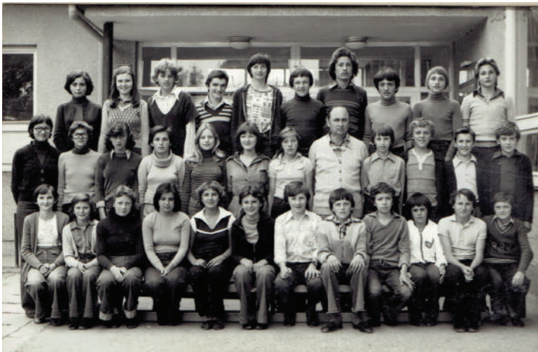
8. b