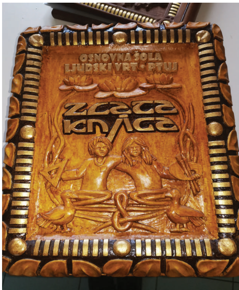
Zlata knjiga, arhiv šole

Naj vam vpis v zlato knjigi pomeni radost in priznanje. Iskrene čestitke!