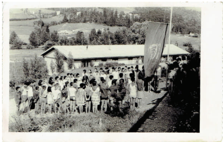
Pionirski tabor, arhiv avtorice

Na tritedenskem taborjenju smo bili pionirji iz vseh republik naše tedanje države, iz Bosne so prišli otroci iz Kaknja, kjer je bila takrat rudarska nesreča. Bili smo na Kozari, na slapovih Plive, v Jajcu ... Lepi spomini!