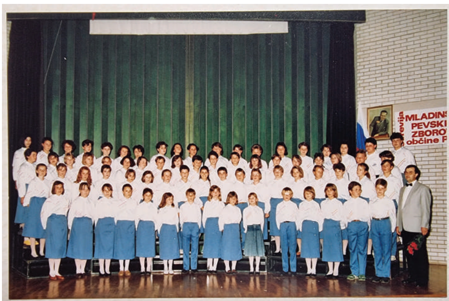
Mladinski pevski zbor