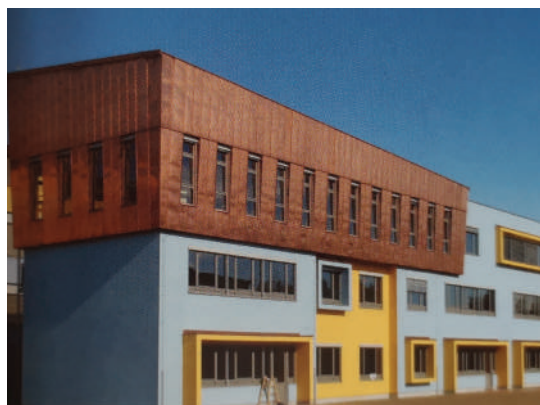
Prizidek z učilnicami za prvo triado, šolski arhiv