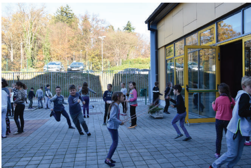
Rekreativni odmor