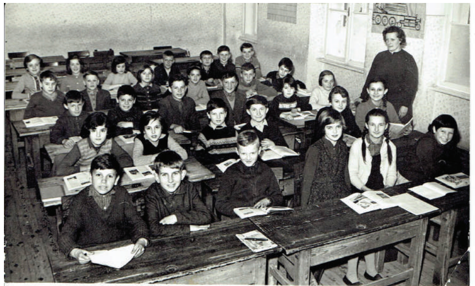
V razredu