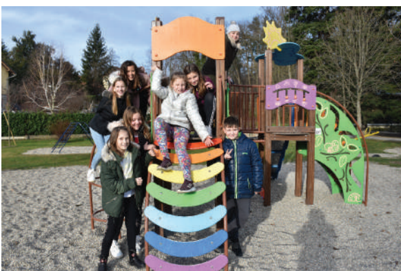
Igrala, šolski arhiv

Veliko je lepih, sladkih spominov. Če bi brskal globlje, bi jih zagotovo našel za veliko strani zbornika in verjamem, da tako tudi vsak, ki je obiskoval OŠ Franca Osojnika oziroma Ljudski vrt.