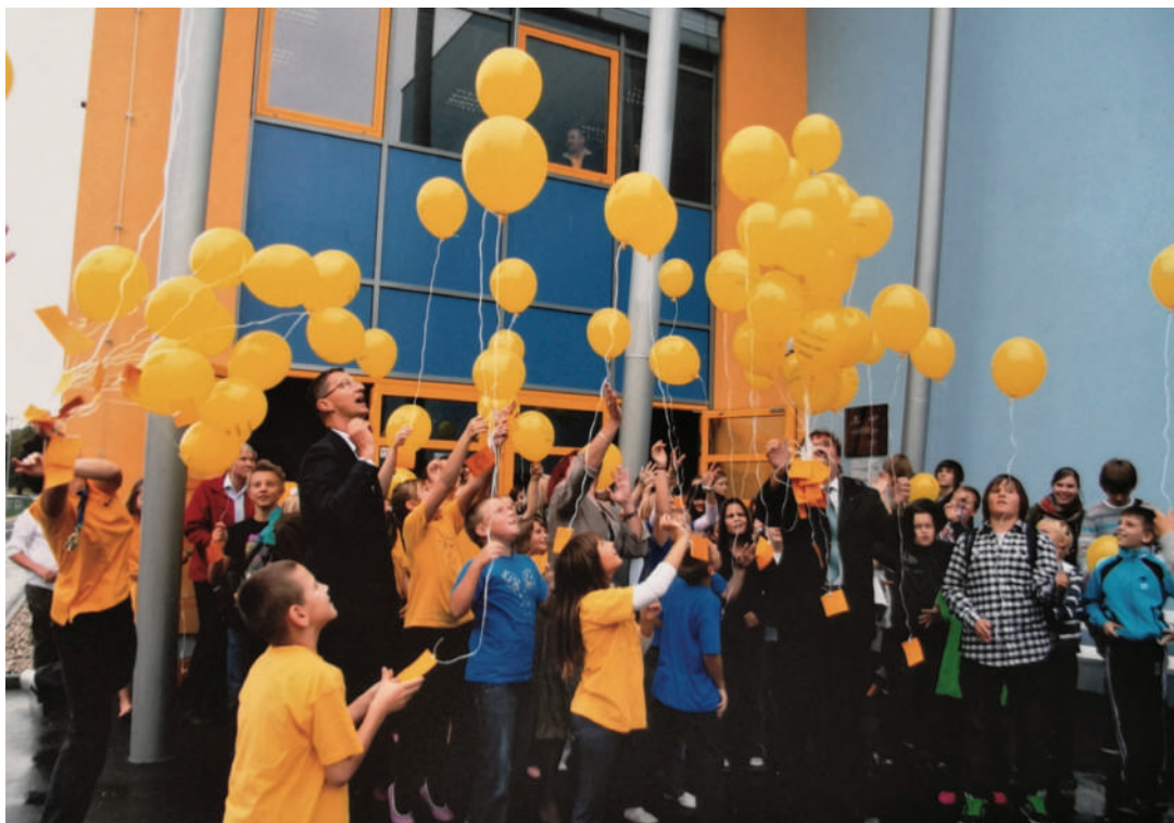
Otvoritev športne dvorane in kuhinje z jedilnico, arhiv šole