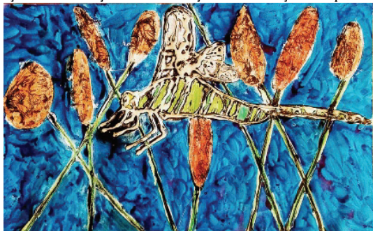
Matija Lačen, 3. a

Za nastanek letošnjega glasila se tako zahvaljujem najprej vsem kreativnim učencem, zatem njihovim učiteljicam in učiteljem ter ustaljeni ekipi, ki že leta bdimo nad pisano besedo in