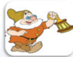
SNEGULČICA & PALČKI