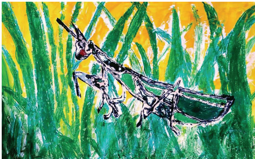
Saša Minič, 3. a