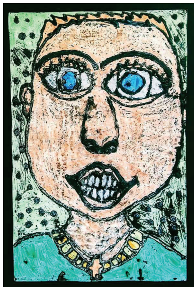
Bastian Kuserbanj, 3. b