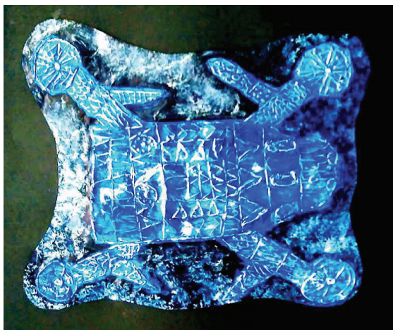
Lana Krampelj, 5. b