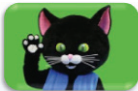
MAČEK MURI 123