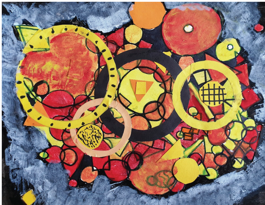
Blažka Markež, 7. a