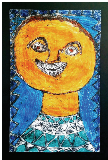
Teodor Težak, 5. a