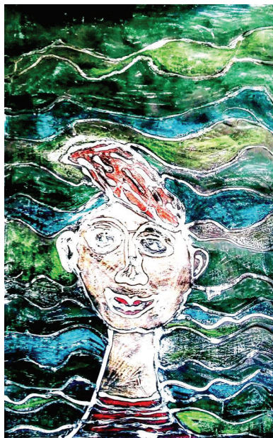
Matija Lačen, 5. a